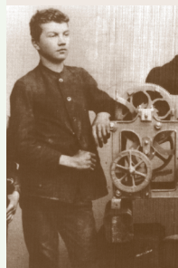
Ein Schlosserlehrling bei Perrot