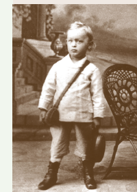
Hermann Hesse, dreijährig, 1880

In der Kindheit scheinen Vergänglichkeit und Tod unvorstellbar weit entfernt. Hermann Hesse hat sie jedoch schon in Kinderjahren erfahren: Zwei Geschwisterchen starben wenige Monate nach der Geburt. Auch im Kreis der Spiel- und Schulkameraden erlebte er frühe Tode. Zwei solche Erlebnisse hat er später als junger Schriftsteller in Erzählungen geschildert, die zum Berührendsten in seinem Erzählwerk gehören.