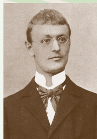
Hermann Hesse, 22-jährig, 1899

Hermann Hesse wurde am 2. Juli 1877 in dem Fachwerkhaus geboren, das am Calwer Marktplatz gegenüber vom Rathaus steht, und verbrachte hier seine ersten vier Lebensjahre. Seine Eltern und Großeltern arbeiteten für die Basler Mission und waren von dieser nach Calw geschickt worden, um hier den christlichen „Calwer Verlagsverein“ zu leiten, der u. a. Schriften für die Mission verlegte. Als Hermann Hesse vier Jahre war, wurde sein Vater als Lehrer in die Basler Missionszentrale berufen, worauf er mit der Familie für fünf Jahre nach Basel zog. Mit neun Jahren kehrte er 1886 aber nach Calw zurück, da sein Vater wieder in den Verlag wechselte. Die folgenden neun Jahre lebte er dann größtenteils in Calw. In dieser Zeit lernte er die Stadt mit all ihren Winkeln und Gassen und ihren Menschen und Schicksalen kennen. Aus diesen Erlebnissen und Erfahrungen schöpfte er später den Stoff für seine rund zwei Dutzend „Gerbersauer Erzählungen“.