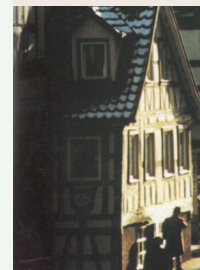
Zwielicht in der Calwer Altstadt