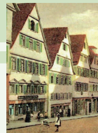
Alte Wohn- und Handelshäuser am Calwer Marktplatz

In einem Fragment gebliebenen Roman erzählt Hermann Hesse die Geschichte eines Zavelsteiner Jungen, der in Calw die Schule besucht und danach eine Lehre als Schlosser macht. Dabei wird das Leben in Stadt und Werkstatt gegen Ende des 19. Jahrhunderts lebendig beschrieben. Nach der Lehre begibt sich Peter Bastian auf Wanderschaft, wobei er weit herumkommt und sich in eine dramatische Geschichte verstrickt.