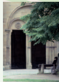
Eingang zum Paradies des Klosters Maulbronn