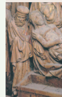
Ausschnitt aus dem Altar der Klosterkirche Maulbronn

Vom heutigen Calwer Sparkassenhaus geht der Blick über die Nagold hinüber zur Bischofstraße, in der das Haus des Calwer Verlagsvereins war, das Hermann Hesse als sein Vaterhaus bezeichnete. Über das Umfeld dieses Hauses, in dem der Großvater und Vater als Verleger arbeiteten und die Familie Hesse zeitweise auch wohnte, hat er zahlreiche interessante Erinnerungen und Erzählungen hinterlassen.