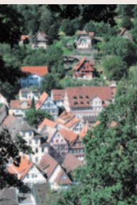
Blick vom Hohen Felsen auf Calw

Am 1. Juli 1895, einen Tag vor seinem 18. Geburtstag, erlebte Hermann Hesse in Calw einen Wettersturm, der große Zerstörungen in der Stadt verursachte. In seiner Erzählung „Der Zyklon“ verknüpfte er den Wettersturm mit einem Liebessturm, der gleichzeitig über den Erzähler hereinbricht. Die Schauplätze sind so genau beschrieben, dass sie sich auf einem Gang über die Höhe oberhalb der Altstadt nachvollziehen lassen.