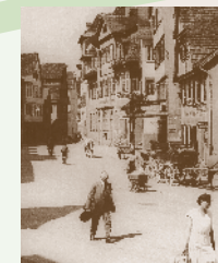
Blick in die Bischofstraße vor hundert Jahren