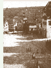
Calwer Marktplatz vor 1900