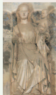
Madonna in der Kirche des Klosters Maulbronn

In diesem Jahr macht der „Gerbersauer Lesesommer“ mit dem dreiteiligen Leseprojekt „Goldmunds Weg“ einen Ausflug zu Schauplätzen, bei denen Hermann Hesse sehr wahrscheinlich Kloster Maulbronn und das Hohenlohisch-Fränkische vor Augen hatte. In Maulbronn („Mariabronn“) erhält Goldmund seine Schulausbildung und findet in dem Lehrer Narziß einen Freund, bevor er aufbricht, um die Welt zu erkunden.