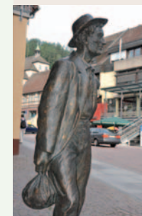
Knulp – Statue in der Calwer Innenstadt

Hermann Hesse wurde manchmal der Humor abgesprochen. Dass er solchen aber durchaus hatte und Selbstironie dazu, zeigt die Erzählung dieser Lesung. In ihr nimmt er bei einem Gerbersauer Jüngling den Traum, ein bedeutender Dichter zu werden, auf die Schippe und damit auch den Traum, den er selbst bereits als Dreizehnjähriger hatte. Allerdings hat die Geschichte dann doch ein anderes Ende, als bei ihm selbst.