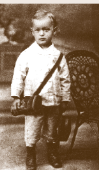
Hermann Hesse, dreijährig, 1880