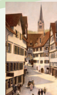
Jugendliche in der Calwer Biergasse um 1900

Seine Schulerlebnisse und -erfahrungen haben Hermann Hesse lebenslang beschäftigt und wurden so zum Gegenstand seines Schreibens. Deshalb verwundert es auch nicht, dass seine letzte, im Alter von 70 Jahren geschriebene „Gerbersauer Erzählung“, ein erregendes Schulerlebnis schildert, das er zwölfjährig an der Calwer Lateinschule erlebte.