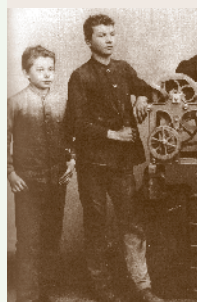
Lehrbub und Geselle in der Werkstatt Perrot

Auf Spaziergängen mit der Familie von Calw nach Hirsau lernte Hermann Hesse bereits als Kind das Kloster Hirsau kennen. Noch prägender wurde für ihn das Kloster Maulbronn, in dessen Seminarschule er 1891/92 acht Monate lebte, die für ihn so schicksalsträchtig verliefen, dass er später als Schriftsteller die Themen Kloster und Klosterschule in seinen Erzählungen und Romanen immer wieder zum Ausgangspunkt machte.