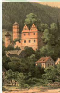
Kloster- und Schlossruine Hirsau

In diesem Jahr kann der „Gerbersauer Lesesommer“ sein 20-jähriges Jubiläum feiern. Aus diesem Anlass wird es an Hermann Hesses Geburtstag am 2. Juli um 20 Uhr vor seinem Geburtshaus am Calwer Marktplatz einen kostenlosen musikalisch umrahmten Vortrag geben, in dem der Frage nachgegangen wird, wie es dazu gekommen ist, dass Hermann Hesse in Calw geboren wurde und aufgewachsen ist, sodass er später als Schriftsteller die Calwer (bzw. „Gerbersauer“) Erzählungen schreiben konnte, die beim „Gerbersauer Lesesommer“ gelesen werden.