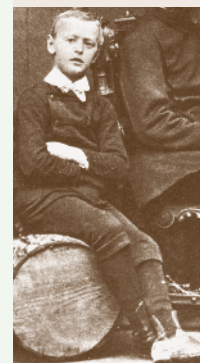
Hermann Hesse, 12-jährig, 1889

Einige „Gerbersauer Erzählungen“ haben nicht Calw als Schauplatz, sondern den an die Stadt angrenzenden Teil des Schwarzwaldes, der „Calwer Wald“ genannt wird. Zwei dieser „Schwarzwald-Erzählungen“ werden bei dieser Veranstaltung in der Burgruine Zavelstein gelesen. Bei einer geht unmittelbar aus dem Text hervor, dass ihr Ausgangspunkt das Städtlein Zavelstein ist. Bei der zweiten, einer dramatischen Liebesgeschichte, ist es nicht so eindeutig; aber auch hier könnte Zavelstein und das Teinachtal der Schauplatz gewesen sein, den Hermann Hesse beim Schreiben vor Augen hatte.